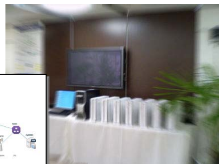
サーバに夏目坂モデルを使用 開発後の実証実験でも活躍